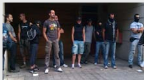
Policías infiltrados esperando a ser rescatados por los antidisturbios.

Tras los incidentes violentos ocurridos en Barcelona durante un acto convocado por el movimiento 15M, circularon imágenes de un grupo de policías infiltrados a los que se acusaba de iniciar los actos violentos. Aparte de que la violencia contra los diputados es rechazable y contraproducente para los objetivos del 15M, hay que subrayar que estos métodos de guerra sucia de la policía para tratar de hundir las luchas y los movimientos son vergonzosos, mezquinos y condenables. VMF