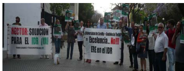
Foto de la concentración de protesta contra el ERE del IDR

Reconocer el carácter de indefinido de los 4 trabajadores con